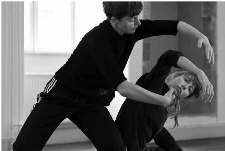
Foto: Arbete med dansproduktion

Behovet gällande danslokaler för ungas utövande och skapande kan inte mötas med dagens resurser. När Fenix ungkulturhus flyttade från Korpenområdet förlorade Visby den enda bokningsbara lokalen för ungas dansträning. Studio 508 kan inte möta behovet, eftersom personal saknas för att tillgängliggöra den till fullo. Det är inte förrän Dans och cirkus kan flytta in i Solberga ungkulturhus som tränings- och repetitionslokaler för dans kan tillgängliggöras kvällstid, tack vara ungkulturverksamhetens möjligheter till öppethållande.